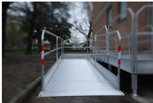
Esempi di rampe