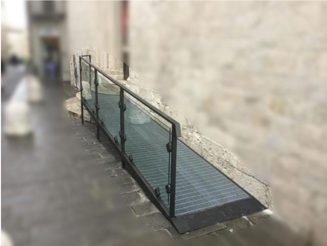
Esempi di rampe e parapetti