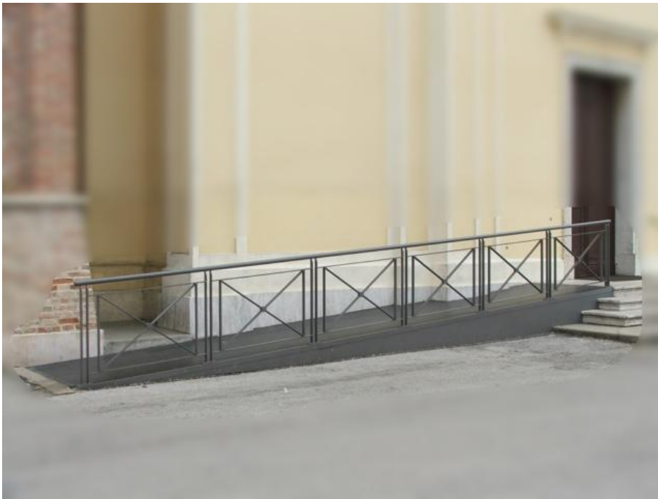
Esempio rampa e parapetti