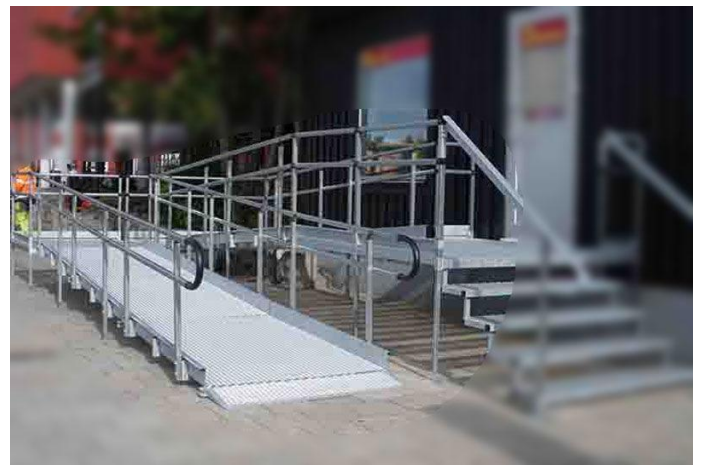
Esempi di rampe e parapetti